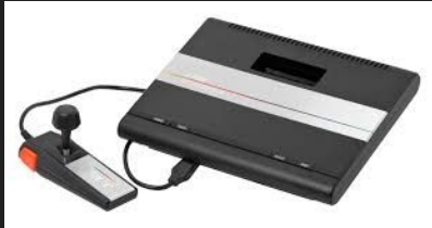
Atari 7800 (1984)