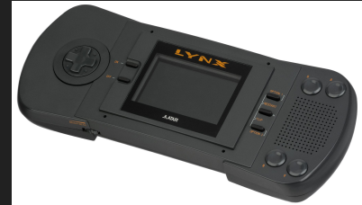
Atari Lynx (1989)