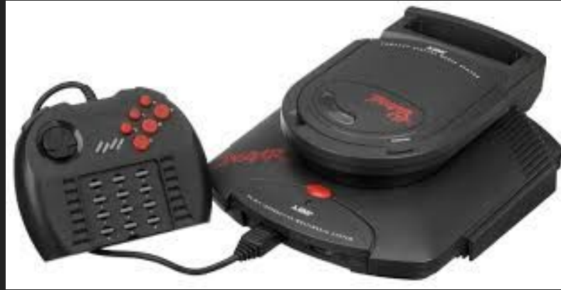
Atari Jaguar (1993)