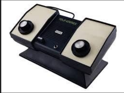
Atari Pong (1972)