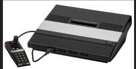
Atari 5200 (1982)