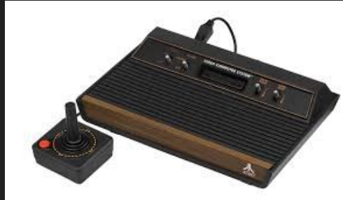
Atari 2600 (1977)