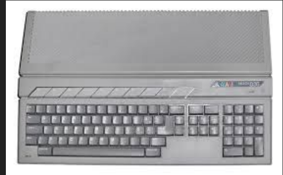
Atari Falcon (1992)