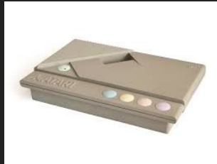
Atari XEGS (1987)