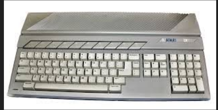
Atari 520ST (1985)