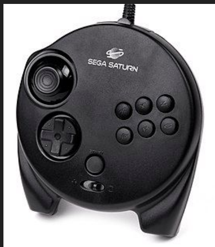
3D Control Pad