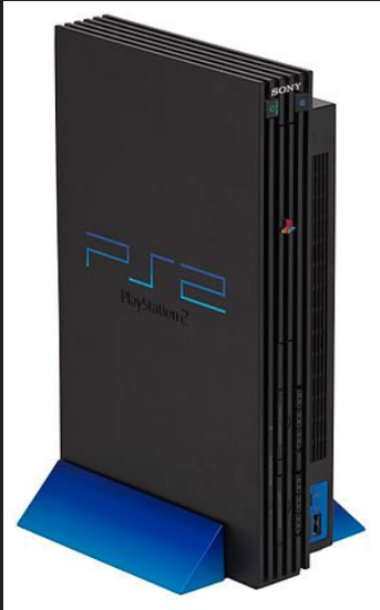
Fat SCPH-10000 a SCPH-18000(2000)