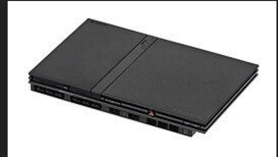
Slim Ver 1 SCPH-70000(2005)